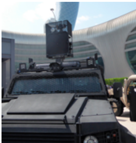
Акустическое устройство, установленное на транспортном средстве