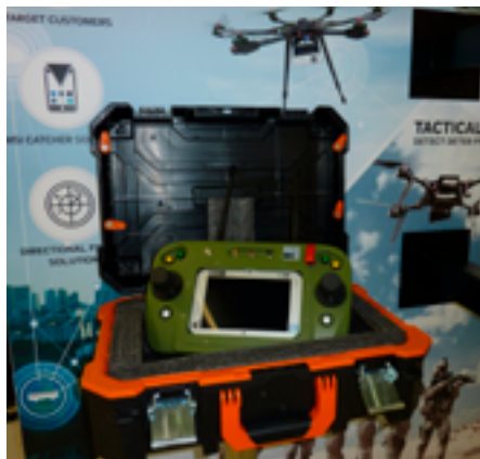
БПЛА с возможностями наблюдения и перехвата информации