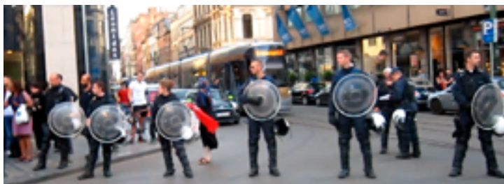
Разомкнутый строй полицейских в Брюсселе (Бельгия), 24 мая 2017 г.