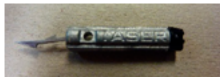
Электрошоковый снаряд – дротик с зацепами (гарпун)

Примером ненадлежащего применения электрошокового оружия является его повторяющееся или длительное применение, а также использование многократных разрядов или разрядов, направленных на неприемлемые для этого или чувствительные части тела (например, голова, грудь, половые органы). В ситуациях контроля толпы существуют дополнительные риски, в том числе опасность возникновения давки, риск попадания в других людей, не являющихся целью для применяемого электрошокового оружия; трудности с обеспечением своевременной медицинской помощи лицам, пострадавшим от неблагоприятных последствий применения такого оружия.