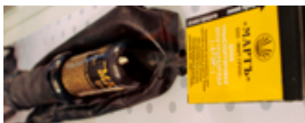
Дистанционное электрошоковое оружие