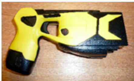
Дистанционное электрошоковое оружие