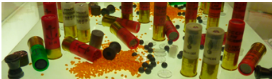
(Ружейные) кинетические снаряды 12-го калибра

лову» 56 . В данном Руководстве говорится, что при стрельбе кинетическими снарядами не следует целиться в голову, лицо и шею, и подчеркивается, что боеприпасы, содержащие несколько снарядов, заведомо не обеспечивают точности и их применение «не может соответствовать принципам необходимости и пропорциональности» 57 .