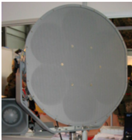
Автономное акустическое устройство

для того, чтобы направить звуковую волну на ограниченную зону 10 ; при этом степень причиняемой боли или раздражения зависит от громкости издаваемого звука и расстояния до устройства.