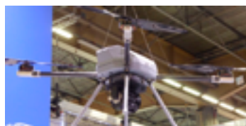
Беспилотный летательный аппарат

Сотрудник полиции с однозарядным ручным пусковым устройством в Квебеке (Канада), 9 июня 2018 г.