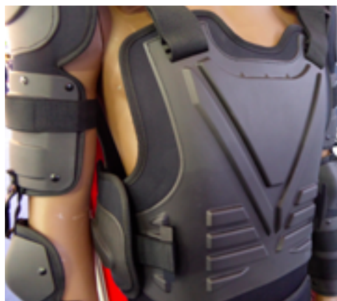
Сотрудник правоохранительных органов со щитом, в комплекте бронезащиты и шлеме для противодействия массовым беспорядкам

Комплект бронезащиты для противодействия массовым беспорядкам