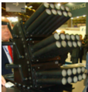
Многоствольное пусковое устройство