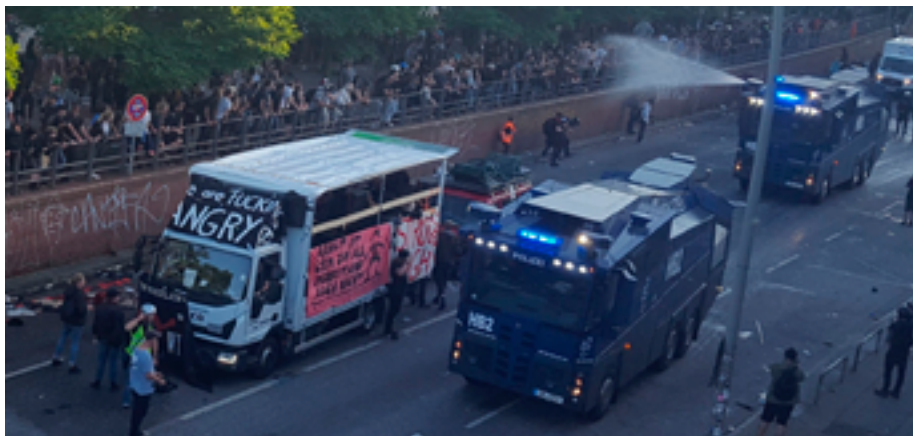
Полиция применяет водомет против протестующих в Гамбурге (Германия) 6 июля 2017 г.