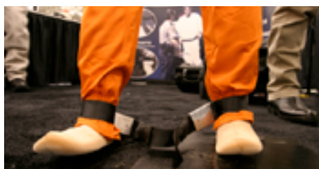
Тканевое средство ограничения подвижности с металлическим зажимом

ограничить подвижность рук, но существуют и модели, предназначенные для ограничения подвижности ног.