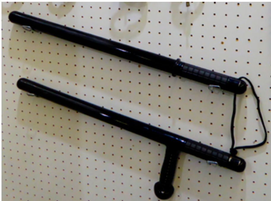
Прямая дубинка и дубинка с боковой рукояткой

группам мышц, расположенным на конечностях, но даже в этом случае ударное оружие может нанести сильные ушибы, рваные раны и вызвать переломы. Это оружие также может использоваться сотрудниками правоохранительных органов для обороны (например, для защиты от ударов нападающего).