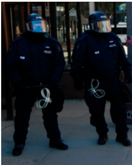
Сотрудники полиции с одноразовыми пластмассовыми наручниками

Пластмассовые средства ограничения подвижности, похожие на «кабельную стяжку» (которая тоже иногда используется), и нейлоновые или текстильные средства ограничения подвижности могут состоять из одного или двух браслетов. Эти средства в основном применяются для того, чтобы