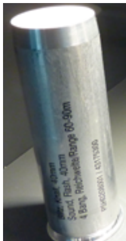
40-мм картридж со светошумовым снарядом