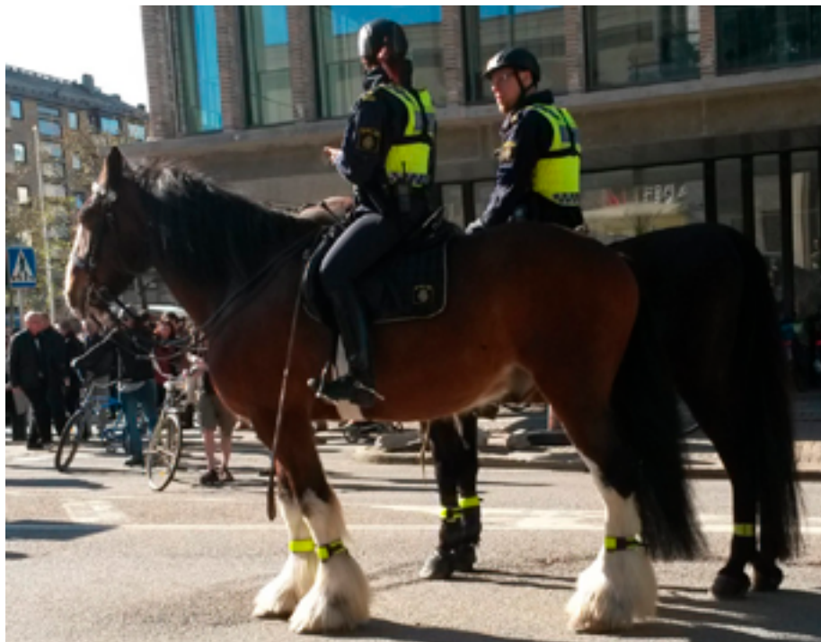
Конная полиция в Гётеборге (Швеция), 1 мая 2016 г.