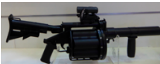
Ручное пусковое устройство