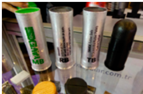
Запускаемые снаряды калибра 38-40 мм