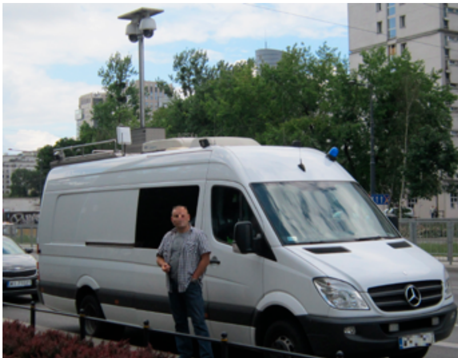
Транспортное средство для ведения наблюдения (Варшава, 9 июля 2016 г.)

Беспилотные летательные аппараты (БПЛА)/дроны для ведения наблюдения все чаще используются для целей контроля толпы. Управление ими осуществляется дистанционно; такие аппараты оснащены камерами для сбора видеодоказательств, а также для организации действий полиции. Дроны позволяют вести наблюдение за обширной территорией, а также отслеживать действия конкретных лиц; они могут помочь сотрудникам правоохранительных органов в выявлении конкретных лиц, подозреваемых в совершении противоправных действий.