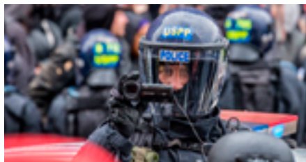
Сотрудник полиции Службы национальных парков США ведет видеосъемку зрителей, наблюдающих за инцидентом, когда сотрудники Службы удерживают группу людей на пересечении 12-й улицы и северо-западной L-стрит в Вашингтоне, округ Колумбия, в день инаугурации президента Соединенных Штатов 20 января 2017 г.

предназначенные для установки и использования в транспортных средствах, а также автономные переносные устройства. Глушители сигнала применяются для того, чтобы затруднить или сделать невозможным использование электронных средств связи в месте проведения собрания, в том числе видеотрансляцию в Интернете в режиме реального времени и публикацию постов в социальных сетях.