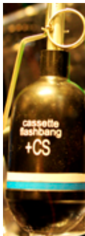
Ручная светошумовая граната с ирритантом CS