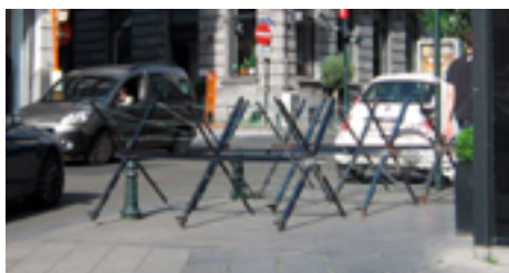
Временное ограждение с колючей проволокой в Брюсселе (Бельгия), 24 мая 2017 г.

запрещено. Использование ограждений в таких условиях не соответствует законной цели правоохранительной деятельности, поскольку она может быть эффективно достигнута с помощью более безопасных альтернатив.