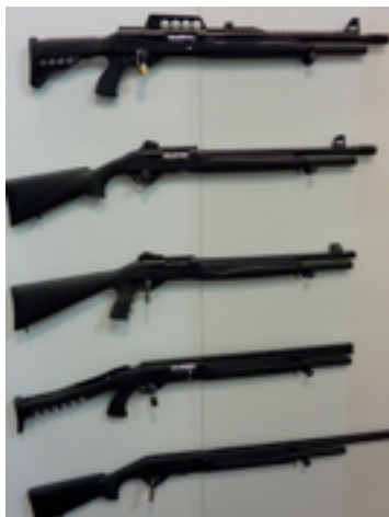
Разные виды ружей