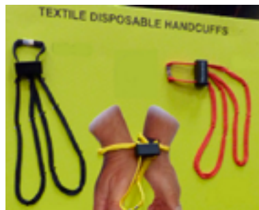
Одноразовые текстильные наручники