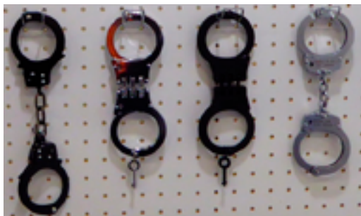
Цепные и шарнирные наручники