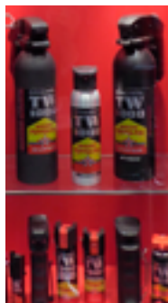
Ручные аэрозольные устройства с ирритантами