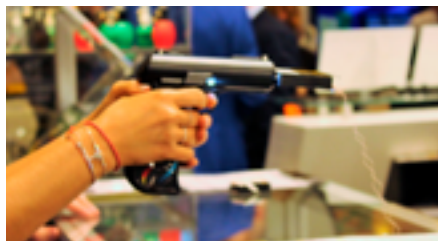
Дистанционное электрошоковое оружие с магазином