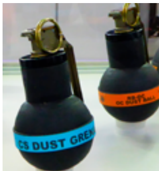
Гранаты с веществами раздражающего действия