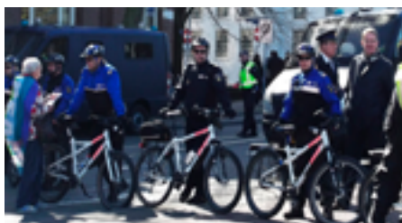
Строй из полицейских на велосипедах в Гааге (Нидерланды), 23 марта 2014 г.