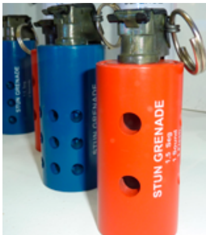
Ручные светошумовые гранаты

Гильза гранаты/картриджа должна быть сконструирована таким образом, чтобы она раскалывалась, а не разрывалась на осколки, с тем чтобы уменьшить опасность ранений; несмотря на это, некоторые гранаты взрываются, и их осколки разлетаются в стороны с большой скоростью. Интенсивность шума и производимой вспышки света различается в зависимости от марки гранат. Некоторые светошумовые гранаты издадут множество громких хлопков и/или испускают множество вспышек, а другие рассеивают ирританты или инертный дым либо выбрасывают множество резиновых шариков или других снарядов.