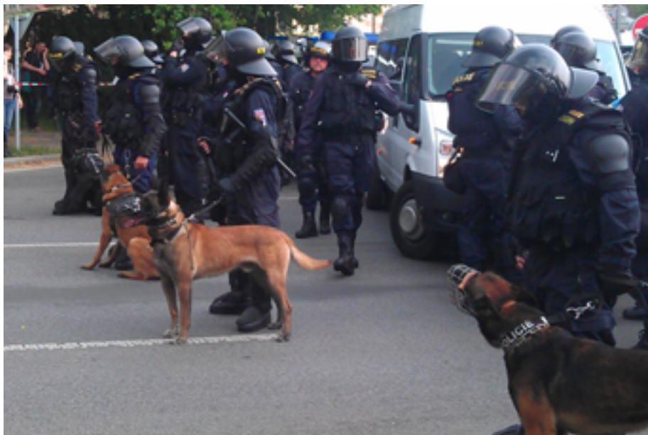
Полицейские собаки в г. Усти-над-Лабем (Чешская Республика), 1 мая 2014 г.

Возможные последствия для здоровья и/или прав человека при использовании для обеспечения правопорядка во время собраний. Применение полицейских собак для обеспечения правопорядка во время публичных собраний является проблематичным в связи с тем, что они могут нападать неизбирательным образом и могут причинить ненужные и/или несоразмерные ранения и травмы. Присутствие собак может пугать людей, поскольку многие испытывают сильный страх перед собаками, и это может быть одним из факторов, побуждающих людей отказаться от реализации своего права на свободу мирных собраний.