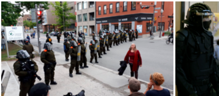
Сотрудники полиции в защитной экипировке в Квебеке (Канада), 7 июня 2018 г.

Сотрудник правоохранительных органов в комплекте бронезащиты и шлеме для противодействия массовым беспорядкам