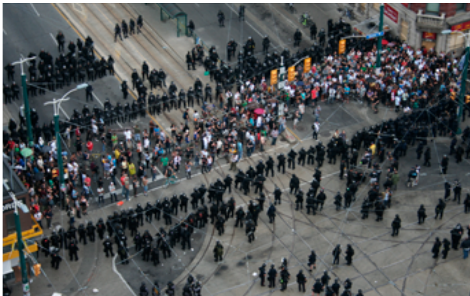
Протестующие во время встречи «Большой двадцатки» в Торонто, удерживаемые сотрудниками подразделения по борьбе с массовыми беспорядками на прямоугольном участке на пересечении Куин-стрит и Спадина-авеню 17 июня 2010 г. (Джонас Наймарк (Jonas Naimark), открытая лицензия Creative Commons: CC BY 3.0).

могут быть затронуты применением этой тактики, включают право на свободу и неприкосновенность личности, а также право на свободу передвижения.