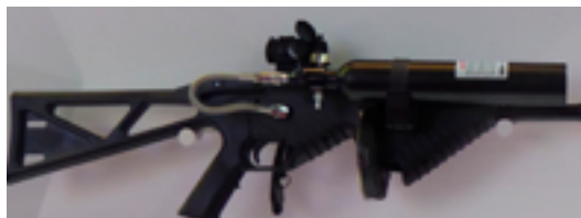
Пневматическое пусковое устройство