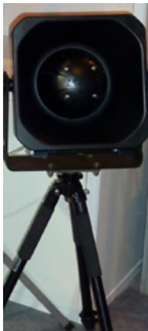
Автономное акустическое устройство

Акустические устройства бывают автономными, установленными на транспортном средстве, встроенными в щиты сотрудников подразделений по борьбе с массовыми беспорядками, а также ручными или нательными (носимыми на плече или крепящимися на груди).