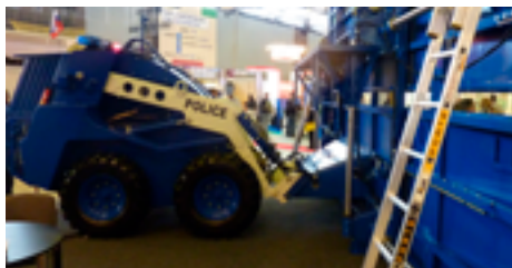
Транспортное средство с прикрепленным ограждением, предназначенное для обеспечения правопорядка во время собраний