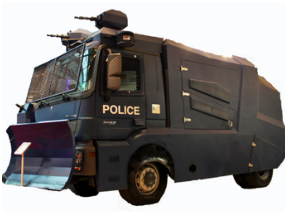
Транспортное средство для противодействия массовым беспорядкам с установленными на нем водометами

по ряду причин. Использование водомета в условиях низких температур (и особенно при температуре воздуха ниже нуля) создает риск гипотермии и обморожения; добавление одоранта в струю воды может быть равносильным коллективному наказанию; использование красителя может привести к незаконным арестам в случаях, когда вода с красителем попала на прохожих; использование смеси воды и ирританта делает невозможной точную доставку соответствующих доз ирританта; использование грязной или иным образом зараженной воды может вести к негативным последствиям для здоровья лиц, против которых применяется водомет.